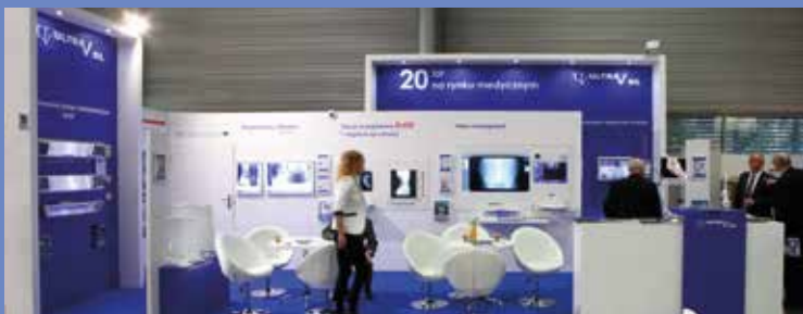
Targi Salmed 2014 w Poznaniu