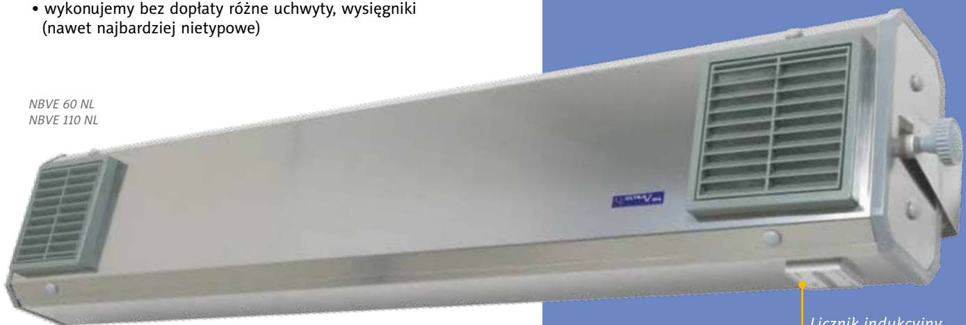
Licznik indukcyjny czasu pracy