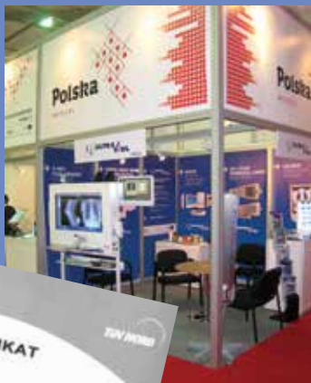
Targi Arab Health w Dubaju 2015

UltraViol jest dynamicznie rozwijającą się firmą produkującą sprzęt medyczny. Działamy od 1993 r. W ofercie mamy szeroką gamę negatoskopów, w tym ledowych, oraz lamp bakteriobójczych przepływowymi i bezpośredniego działania. Jesteśmy producentem pierwszej polskiej lampy przeciwdepresyjnej Fotovita.