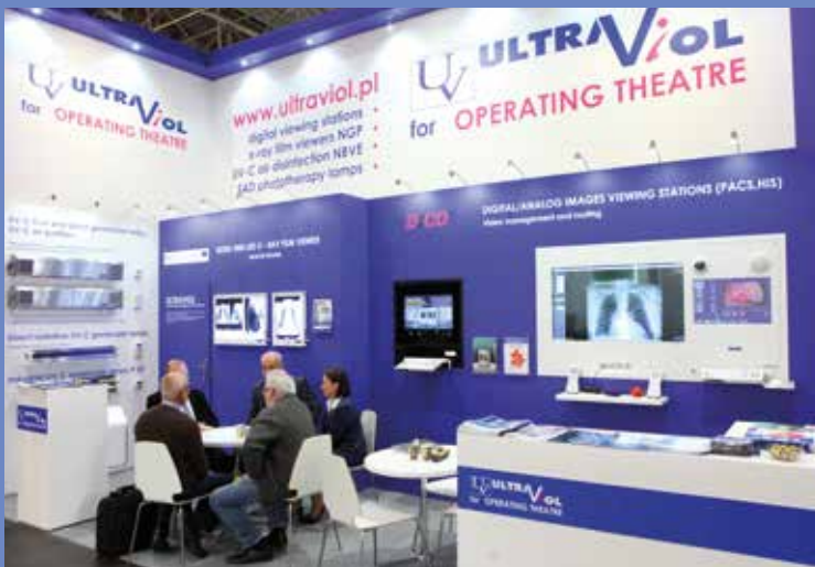
Targi Medica 2014 w Düsseldorfie